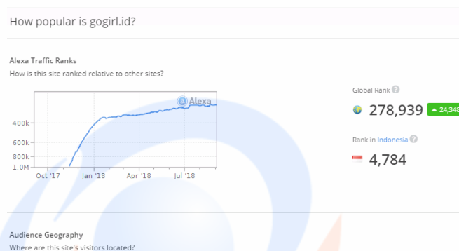
Gambar 1.1 Peringkat Gogirl.id di Alexa.com

Baik cetak maupun online , mereka sama-sama menyajikan berita hiburan dari dalam dan luar negeri. Berita yang dibahas adalah seputar kehidupan remaja perempuan yang nyata, kreatif, dan penuh inisiatif dengan adanya beragam latar ekonomi, sosial, budaya, dan pendidikan. Target pembaca Gogirl! Magazine adalah remaja perempuan yang berusia 15-22 tahun. Oleh sebab itu, bahasa yang digunakan pun disesuaikan dengan target pembaca Gogirl!.